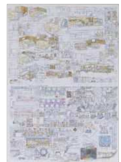
「寝台特急」 tada (ただ)