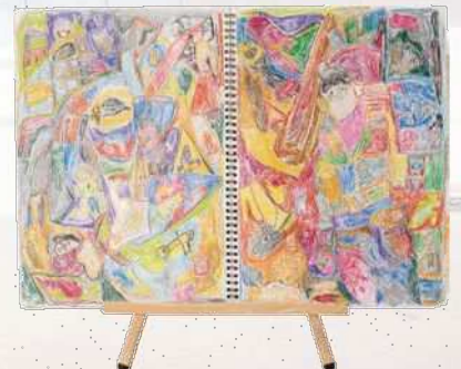
「松江の町」 加藤 貴治 | 2023 年度 銅賞