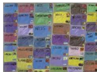
「無題」 坂口 真一郎