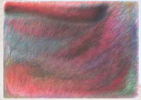
「無題」 吉原 俊夫 | 2023 年度 銅賞