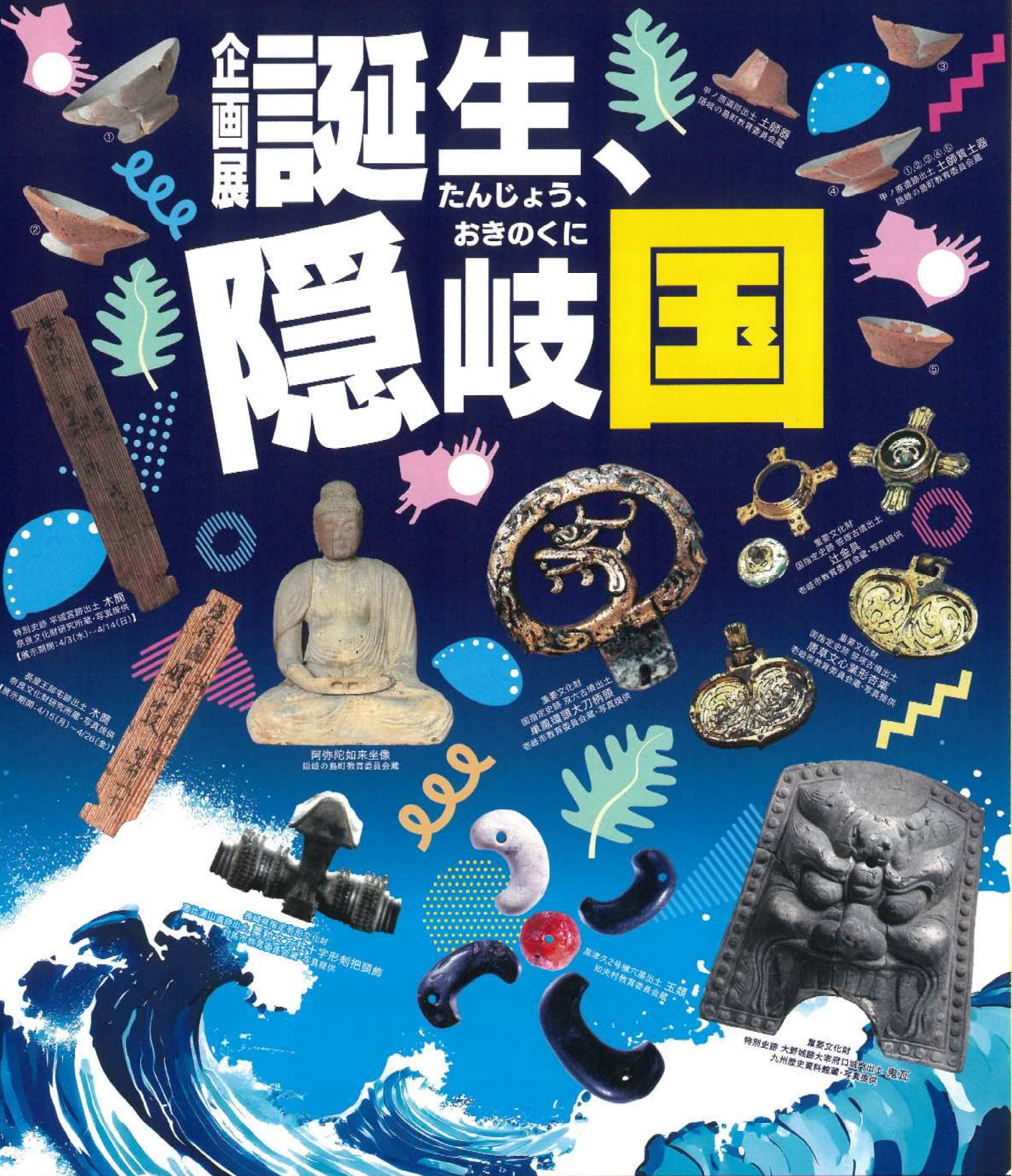
特別史跡 平城宮跡出土 木簡 【展示期間：4/3(水)～4/14(日)】