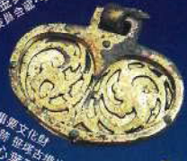
重要文化財 高瀬堂史跡 志保古墳出土 藤原文心葉形香環