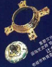
重要文化財 高瀬堂史跡 志保古墳出土 土金具