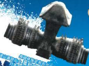
重要文化財 長尾山遺跡出土 新式刀柄上字形刺把頭飾