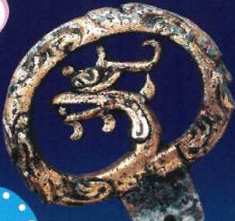
重要文化財 隠岐歴史跡 穴六古墳出土 鳳凰鏡頭大刀柄環