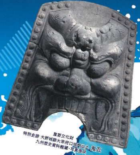
重要文化財 特別史跡 大野城跡大宰府口城跡出土 鬼面