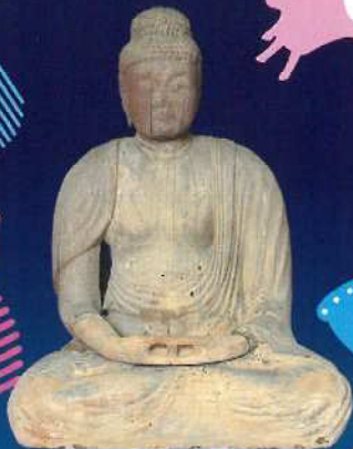
阿彌陀如来坐像 隠岐の島町教育委員会蔵