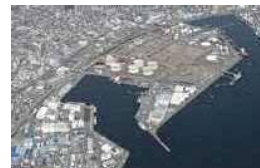
太陽光発電と大型蓄電池によるマイクログリッド（静岡県静岡市）

2030年度までに民生部門の電力消費に伴うCO 2 排出実質ゼロを実現するにあたり、デジタル技術も活用して脱炭素化に取り組み、地域課題の解決につなげる地域づくりを目指す。