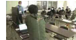
データを活用したスマート農業の取組（高知大学）

地域産業・若者雇用の創出や、地元企業や地方公共団体と連携した地方大学の取組を促し、大学を核として地方活性化が図られるような地域づくりを目指す。