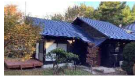
ワーケーション可能な農泊施設（イメージ）

中山間地域の基幹産業である農林漁業の「仕事づくり」を軸として、豊かな自然、魅力ある多彩な地域資源・文化等やデジタル技術の活用により、活性化を図る地域づくりを目指す。