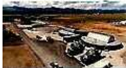
スマートなまちづくりプロジェクト（北海道上士幌町）

地方活性化に取り組むに当たり、SDGsの理念を取り込むことで、政策の全体最適化や地域課題の解決の加速化という相乗効果を生み出し、未来志向で持続可能な地域づくりを目指す。