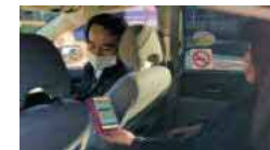
MaaSアプリを利用したタクシー配車（群馬県前橋市）

地域住民等の移動ニーズに対応して、複数の公共交通やそれ以外の移動サービスを組み合わせる検索・予約・決済等を一括して行うMaaSを実装し、移動の利便性向上等が図られたまちづくりを目指す。