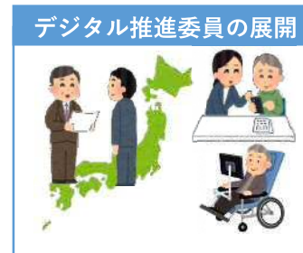
デジタル推進委員の展開