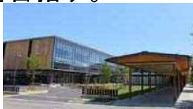
スマートシティAiCT（福島県会津若松市）

①スマートシティ・スーパーシティ データ連携基盤などのデジタルやAI、IoTなどの未来技術を活用して、地域の抱える様々な課題を高度に解決することにより、新たな価値を創出し、持続可能な地域づくり・まちづくりを目指す。