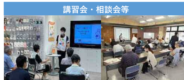
講習会・相談会等