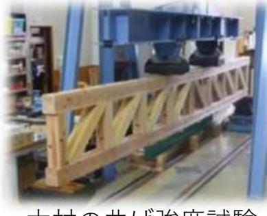
木材の曲げ強度試験