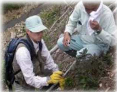
コンテナ苗の育苗技術の開発