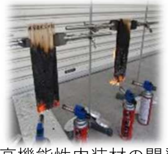
高機能性内装材の開発 (難燃化処理技術の研究)