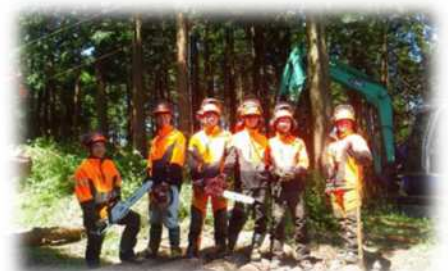
島根県立農業大学校 林業科での実習