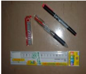
ボールペン など文房具