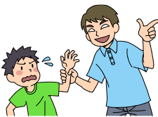
知らない人にはついて行かない