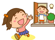
遊びに出かける時は家族に行き先を言う