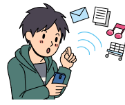
インターネットはルールを守る