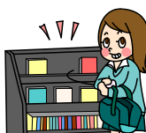
万引きは絶対にしない