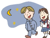
夜遊びや外泊はしない