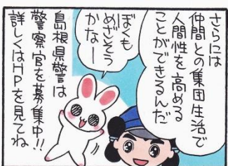
まんが 柏屋コッコ