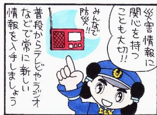
まんが 柏原コッコ