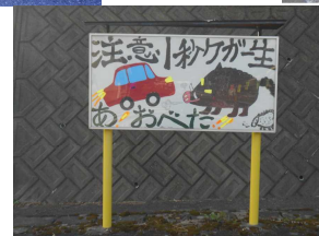
久野地区 交通安全啓発絵画