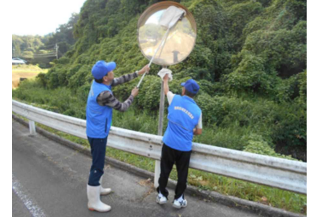
佐世地区 ミラー清掃