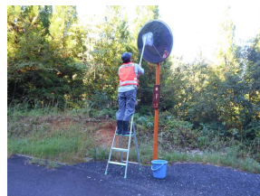
阿用地区 ミラー清掃