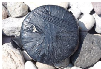
大津久海岸に漂着したコカイン