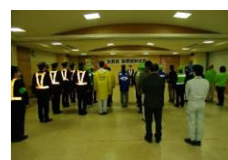
歳末特別警戒出発式