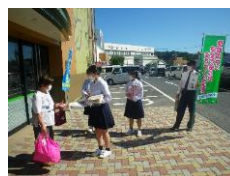
特殊詐欺被害防止チラシ配布