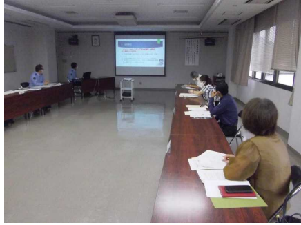
【諮問事項説明状況】