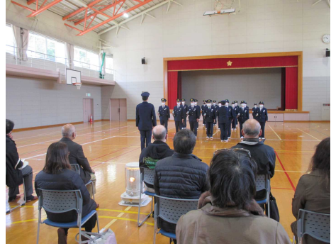
【視察状況（授業見学）】