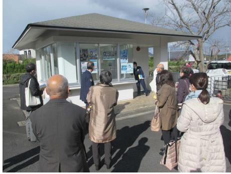
【視察状況（施設見学）】