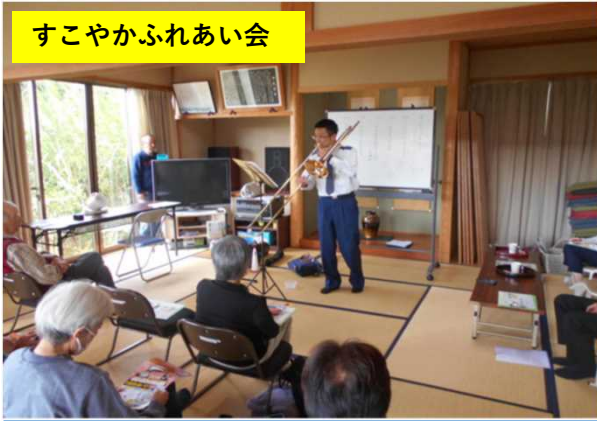
すこやかふれあい会

令和6年11月24日(日) 東生馬地区の高齢者を対象とした「すこやかふれあい会」の会合中に講師として防犯講話(夜光反射材の着用・ロマンス詐欺の被害防止・闇バイト強盗に関する注意)を主催者の要望により楽器の演奏を交えながら行いました。