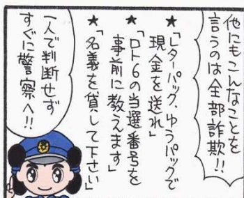
まんが 柏屋コッコ