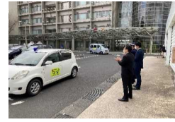
特殊詐欺被害防止声掛けマニュアル 歳末特別警戒出動式