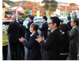
歳末特別警戒視察