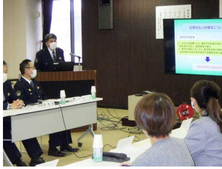
諮問状況（総務課長説明）