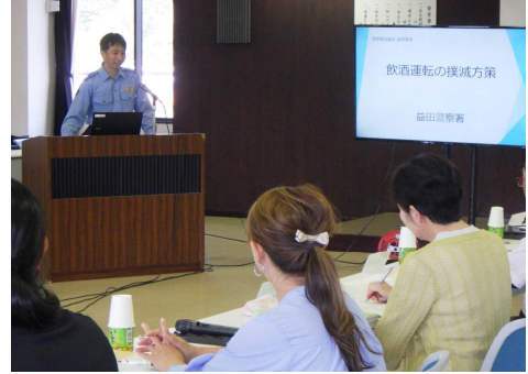
【諮問状況（交通課長説明）】