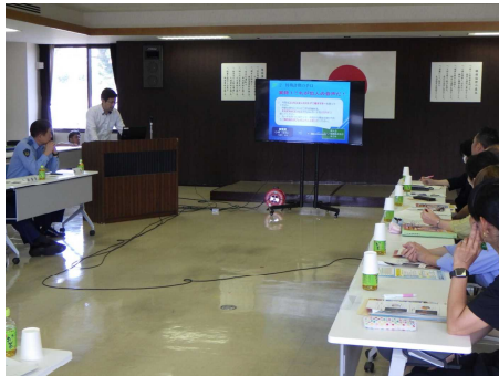
【業務報告（生活安全課長説明）】