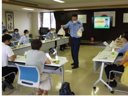
諮問状況（交通課長説明）