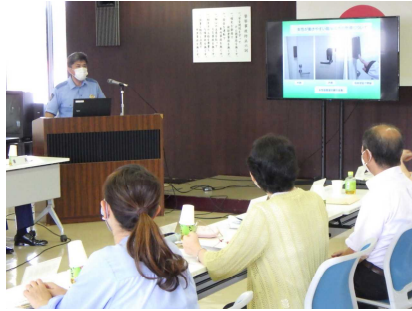
業務報告（総務課長説明）