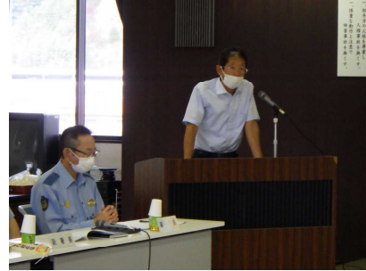
業務報告（生活安全課長説明）