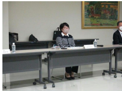
諮問に対する答申