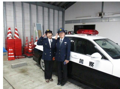
パトカーの視察及び乗車体験