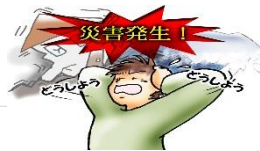
非常持ち出し品チェック表