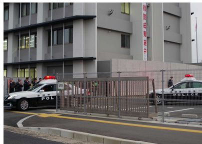
【歳末特別警戒出動式】