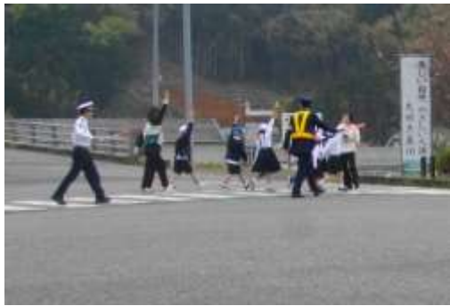
正しい横断の練習の様子