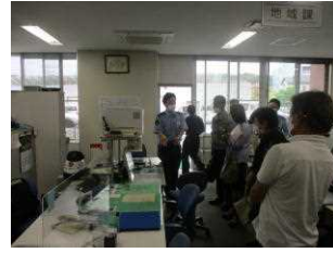
【通信指令システム視察状況】