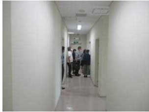
【留置場内視察状況】