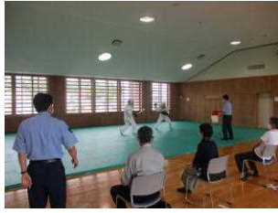
【逮捕術訓練視察状況】