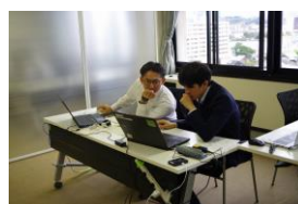
【サイバーセキュリティ競技会】