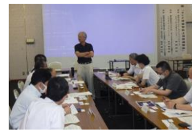
【サイバー攻撃体験型机上演習】