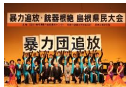
【暴力追放・銃器根絶島根県民大会】