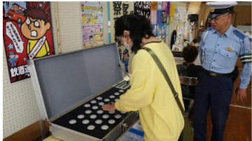
【参加・体験型の交通安全教育】