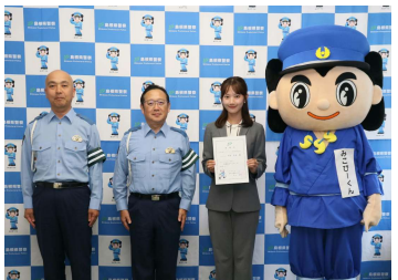
【交通安全ナビゲーター委嘱式】