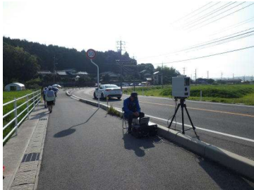
【可搬式速度違反自動取締装置による取締り】