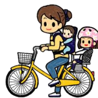
幼児座席 + 背負い（4歳未満）