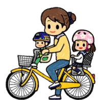
前形座席 + 後形座席