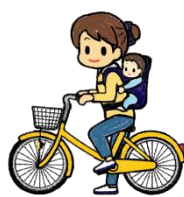
4歳未満の者を 確実に背負う