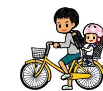
16歳未満の者が幼児を 乗せて運転するのはダメ