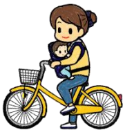
抱っこでの運転はダメ （制動等の際に幼児に危険が 及ぶおそれがあるため）