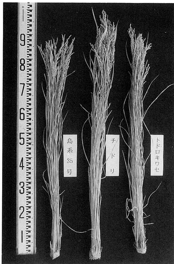
写真1 「ときめき35」と比較品種の草状 左から ときめき35 (島系35号), チドリ, トドロキワセ