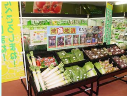
直売コーナーの設置