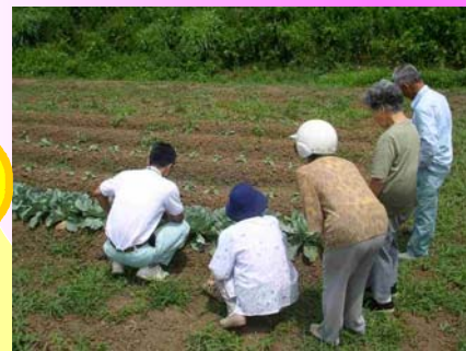
野菜の現地栽培指導