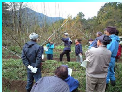
新規生産者の掘り起こし