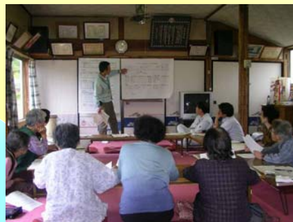
生産履歴の記帳指導