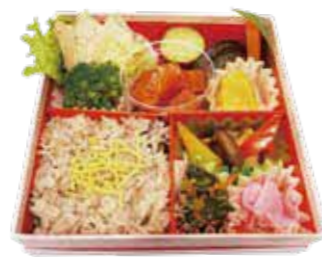
「愛情たっぷりトマト手箱」弁当

・商品の問い合わせ先：(資)一文字家 (営業時間)9:00～17:00 (TEL)0852-22-3755