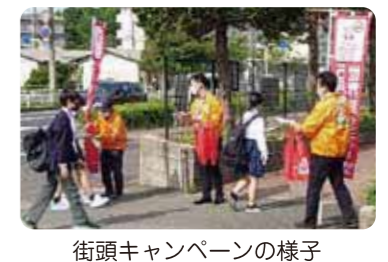
街頭キャンペーンの様子