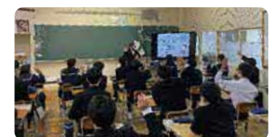
出前講座の様子(真ん中～下)