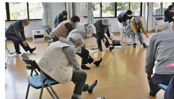
～こけないからだ体操の様子～

いつまでも元気で生活するために、松江市・安来市において健康づくり・介護予防などの取り組みとして高齢者の方が参加する通いの場などで介護予防の体操などが行われています。