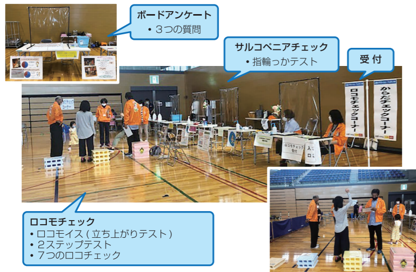
ボードアンケート ・3つの質問

新型コロナウイルス感染症の影響が懸念される中、感染対策に気をつけながら実施し、委員の方やまめなサポーターの方と力を合わせて取り組み、68名の来場者へ啓発ができました。