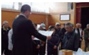
<ゲート野外チーム>