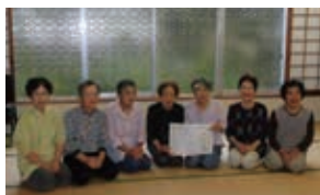
<東出雲ストレッチ体操>