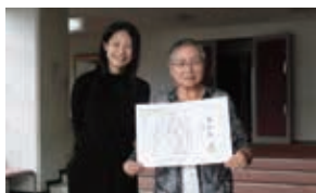
<くながやが寄り合い事業(橋南地区)>