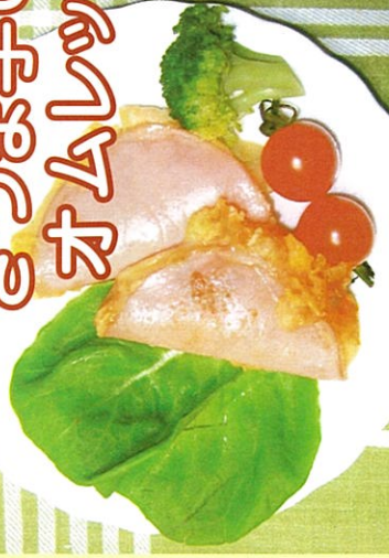
〔使用した地元食材〕さつま芋、ブロッコリー、ミニトマト