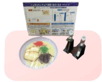
とんこつラーメン