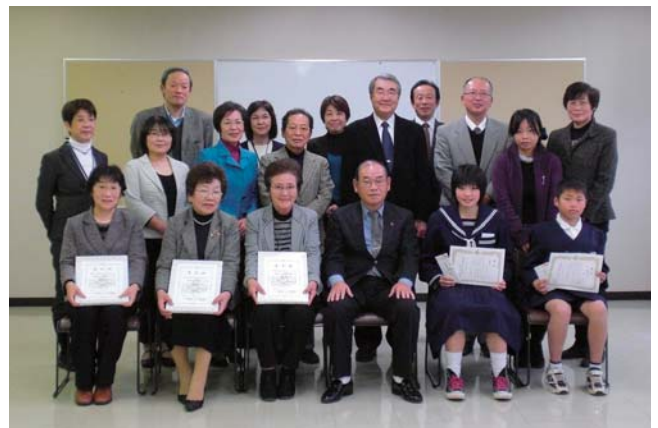
↑平成23年12月16日に開催された、「健康づくり・生きがいづくりグループ」及び「こころの健康標語」表彰式の写真です。