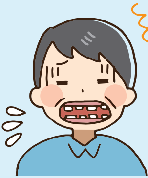
噛めないものが増えた