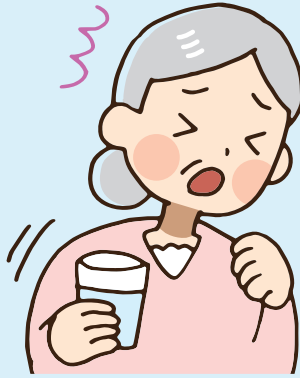
むせやすくなった