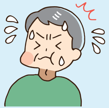
薬が飲みこみにくくなった