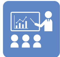
事業主セミナーの 開催予定