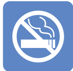
禁煙治療の 実施医療機関