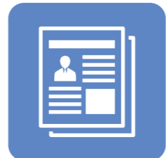
事業所の 取組事例