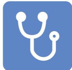
病気・メタボの 予防法

従業員の健康づくりに取り組んで しまね★まめなカンパニー & ヘルス・マネジメント認定制度 に登録しよう!