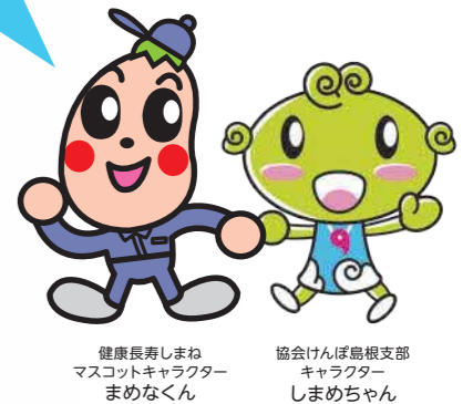
健康長寿しまね マスコットキャラクター まめなくん