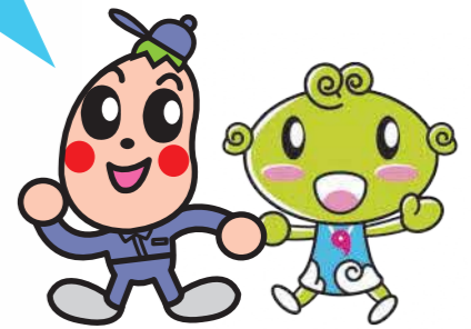
健康長寿しまね マスコットキャラクター まめなくん