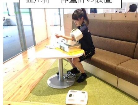
血圧計・体重計の設置