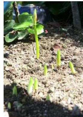
彼岸花伸びる速度速いね