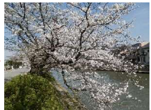
市役所裏の桜 早く観てね

浜田市の保健師さんにいろいろ相談して(^^)v ね 7E-77 の ほっとサロン浜田 も見てください