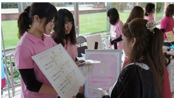
(子宮頸がんについてのアンケート)