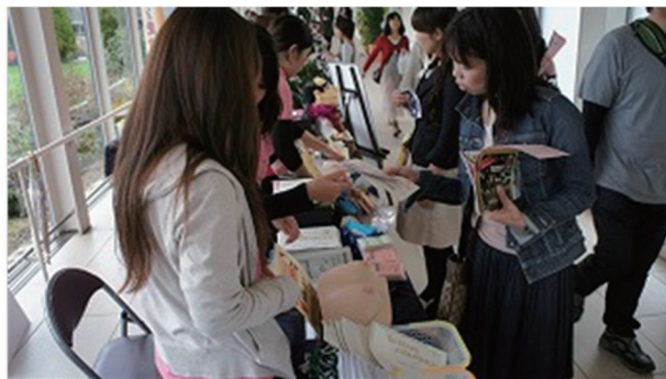
(手作りチラシの配布)