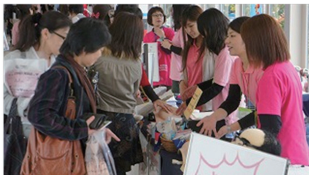
(視触診モデルの体験)