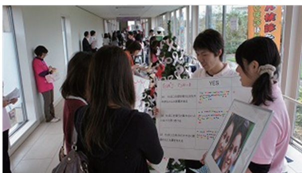
(たばこについてのアンケート)