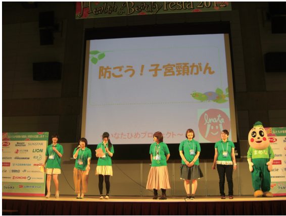
(ステージ発表の様子)

初めて参加する新入生は緊張していたが、積極的に話しかけることができ前よりしゃべることができるようになった。という意見や声のかけ方等勉強になりました。との意見があり、今回のイベントは参加したいなためメンバーの能力の向上につながったといえる。