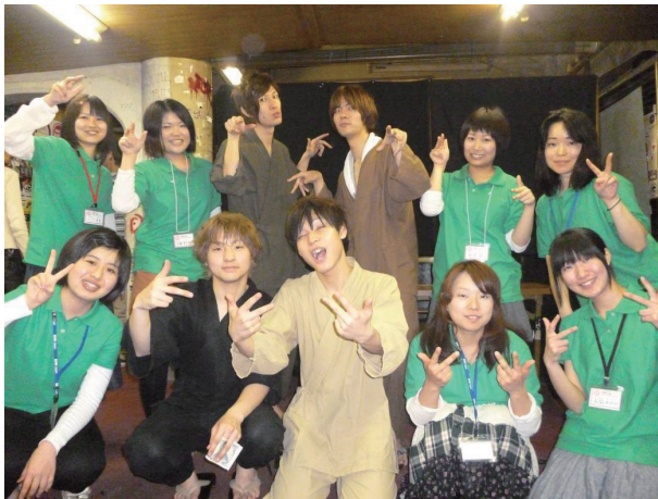
(ぼすとん茶の湯会メンバーといなたひめ)

Q4 の男性正解者が少なかったのは、今回の企画の目的である、「女性の病気ではあるが、男性にも子宮頸がんについて知ってもらい、大切な人へ子宮頸がんのワクチンや検診の大切さを伝えてもらう」ことを十分達成することができなかつたと考える。そのため、男性が女性へ、検診やワクチンを受けることの大切さを伝えるきっかけになる企画内容を考えることが必要。また、女性は近々検診が受けられる場があることを伝えたため、印象に残り検診に行こうと思ってもらえたのではないかと考えられる。