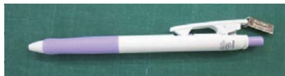
「ボールペン(紫色)」 作成時期：2013年3月