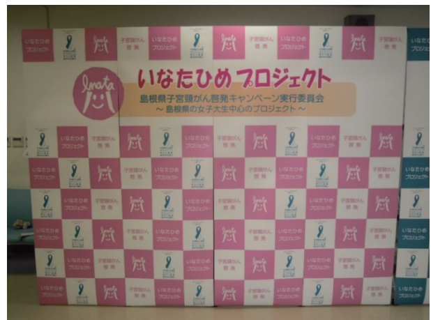
「バックボード」作成時期：2013年3月 サイズ：2.2m×2.2m