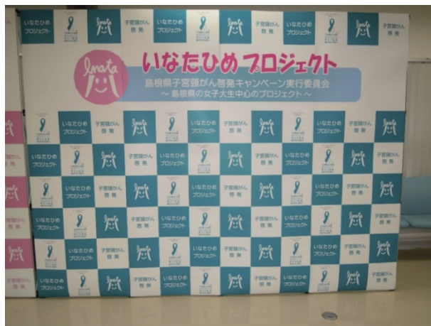
「バックボード」作成時期：2013年3月 サイズ：2.2m×2.2m