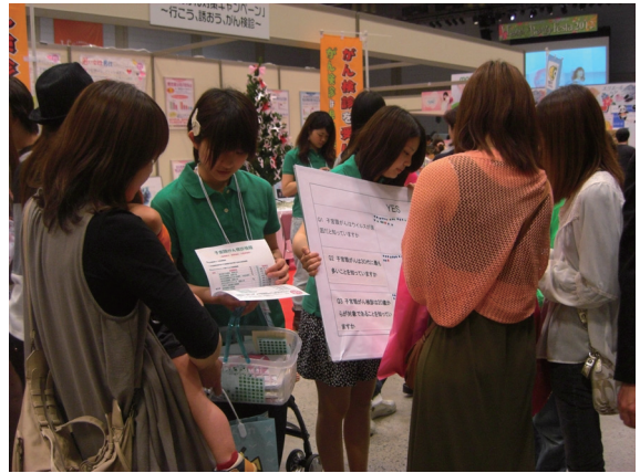
(ボードアンケート)