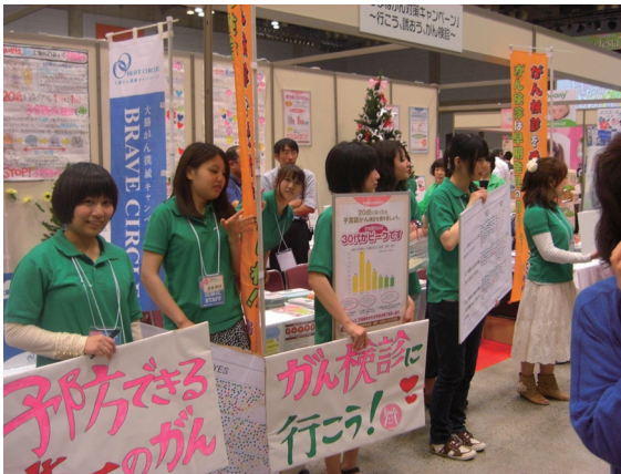
(参加者に呼びかける学生達)