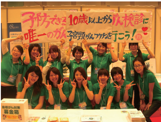
(イベントを終えて)