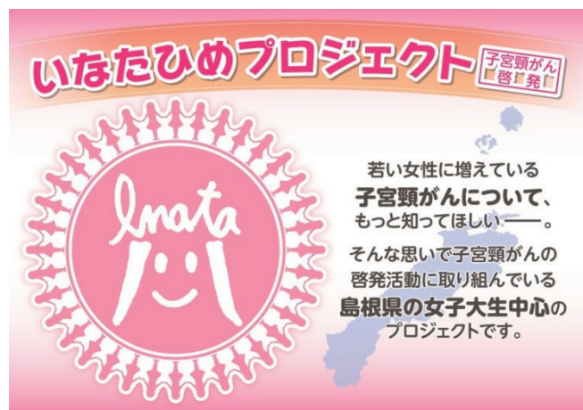
「タペストリー」作成時期：2012年11月 サイズ：A1(84.1cm×59.4cm)