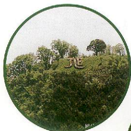
旭公園から見る家古屋山