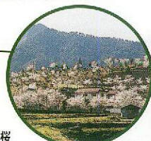
運動公園周辺の桜