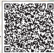
しまね電子申請サービス

裏面の応募用紙に必要事項を記入し、郵送またはしまね電子申請サービスで提出してください。→