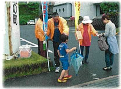
街頭キャンペーンの様子↑