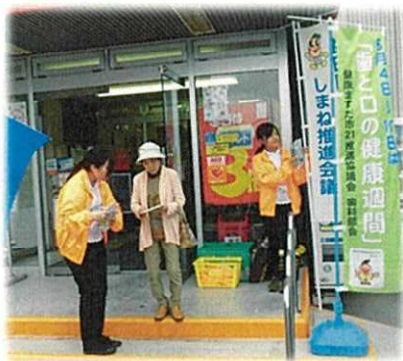
←街頭キャンペーン の様子