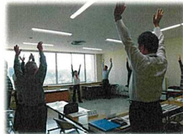
スポーツ推進員への体操紹介の様子→