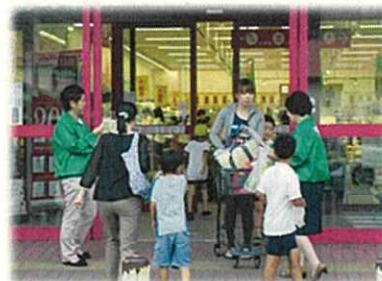
街頭キャンペーンの様子↑