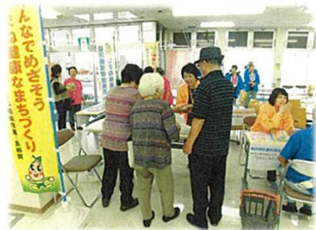
まめなくんの健康広場