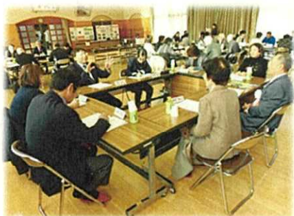
←グループワークの様子