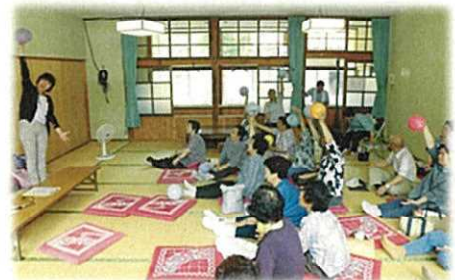
高齢者サロン訪問時の様子↑