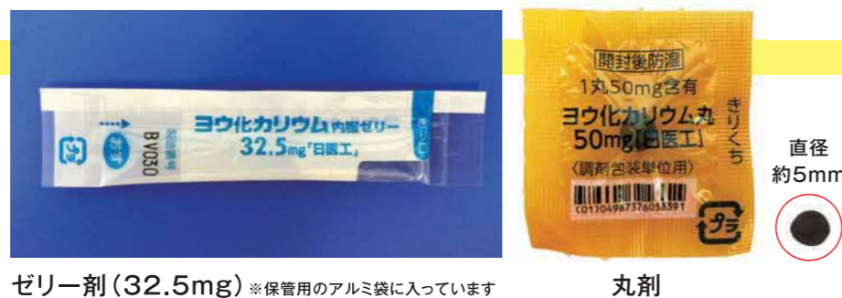
ゼリー剤 (32.5mg) ※保管用のアルミ袋に入っています