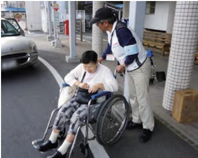
玄関での車いす介助

「病院を元気にする集い・がんばれ雲南病院市民の会」は、右に述べた「雲南市立病院ボランティアの会」と、「がんばれ雲南病院市民の会」に発展し、活動を続けています。