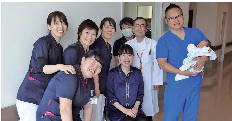
助産科集合写真（筆者は後列左から3番目）