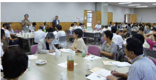
「看取り」について住民研修

2025年問題、地域包括ケアシステムや在宅医療・看護などのように、個人がそれぞれ自分自身で解決しなければならぬ課題が、今後ますます増加すると考えられます。しかし、自分だけでは解決しきれない場合、医療機関、行政、住民が連携しながら個人を支えなければならぬと思います。住民がその役割を担えるようになるには、一人一人の住民が、地域において何ができるのか、住民でなければできないことは何なのかについて考え、行動する必要があります。市民の会やボランティア活動は、その一つの取り組みであると考えています。