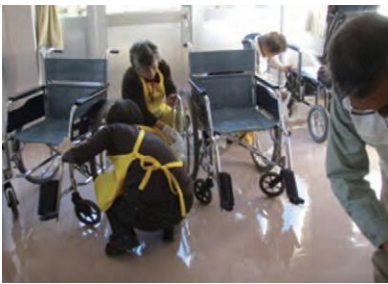
院内の車いす整備

高齢化社会が到来し、在宅医療、介護、終末医療、看取は身近で、これらは避けては通れない問題になっていきます。