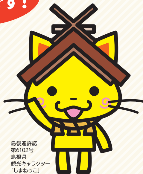
島観連許諾 第6102号 島根県 観光キャラクター 「しまねっこ」